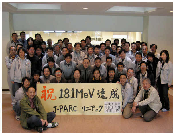
図1. 181MeV加速達成の記念撮影 (2007年1月24日)

このように運転時検査の受検を急いだ背景には、J-PARC全体の放射線申請の計画、リニアックの合格が遅れば後続の各施設の申請スケジュール、ひいては建設スケジュールに大きな影響を与えかねないという事情があった。リニアックでは、当初の計画より2ヶ月ほど早く運転時検査に合格することができたが、このことは、早期にこのようなリスクを回避できたという意味で、我々にとって大きな意義をもつものであった。