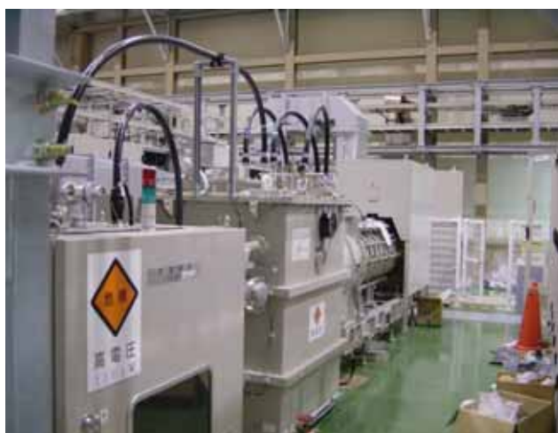
図3：(上)クライストロン(Kly)高圧電源室、手前より奥へHVPS1～6号機が並ぶ。(下)Klyギャラリー、左手前より断路器盤、M・アノードパルス変調器、324MHzクライストロン。

電源システムの実負荷試験は、HVPS5号機が今年2月、4号機が今年3月に各々実施され、それに引き続き運転を行なった。クライストロン試験開始時に真空悪化が殆んど見られなかったため短時間で高電圧まで上昇させた、データ取得の為頻りに電圧を変えた、Klyカソードで測定される電圧を110kVとするためHVPS電圧設定値を112kV以上まで上げたなど、特殊な運転だった。図4にHVPS5号機での試験時の波形を示す。総運転時間はHVPS4号機が約370時間、5号機が約500時間だった。