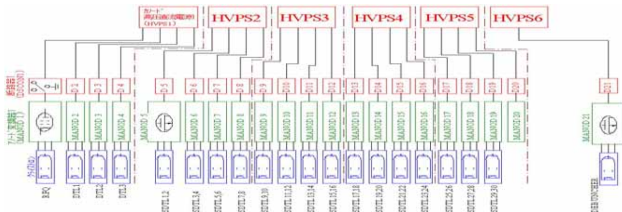
図1：クライストロン電源システムの全体構成

当クライストロン電源システムは、6台のカソード高圧直流電源(以下、“HVPS”と略記)、21台の断路器盤(DSCON)とM・アノードパルス変調器(MANOD)、およびそれらを制御する制御盤で構成されている。図1に全体構成の概略図、図2(次ページ)に、HVPS2~5号機の回路を例とした機器構成の概略図を示す。実配線では、HVPSを構成する各機器間、およびクローバ装置~DSCON間に接地用の銅板が敷設され、クライストロン高圧電源用の保安接地極 [7] で接地されている。システムの制御はPLC