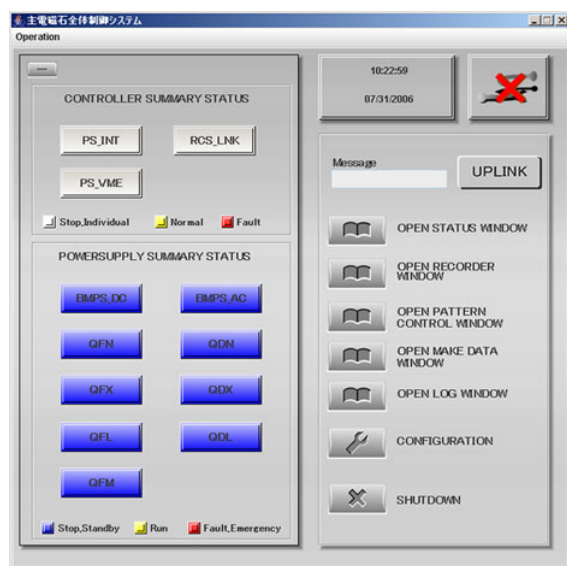
図 2 アプリケーション起動画面

アプリケーションの起動は、ワークステーションのウィンドウシステムから起動する。図2に起動最初の画面を示す。