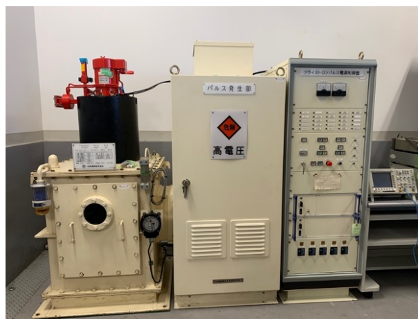
Figure 1: Photograph of pulse modulator and klystron.

図 1 にパルス電源とクライストロンの外観写真を示す。図 1 において、左から制御盤、パルス発生回路部、