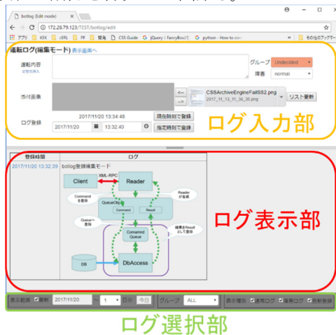
Figure 2: 編集モード画面

ループの絞り込みを行うドロップダウンメニュー、表示する期間を変更するメニュー等を備えている。また、過去に入力した内容を変更する場合には、ログリスト内の登録日付時刻へのリンクをクリックする。変更用ダイアログがポップアップ表示されるので、そこで編集作業や項目の削除を行うことができる。