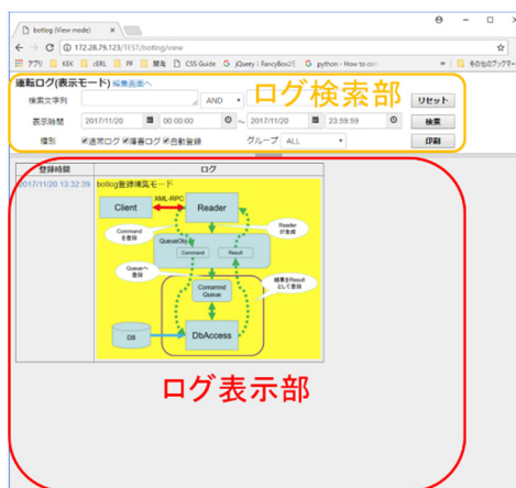
Figure 3: 閲覧モード画面

閲覧モードでは時間降順に表示するため主として表示後に紙媒体に印刷し・保存する用途に適している。