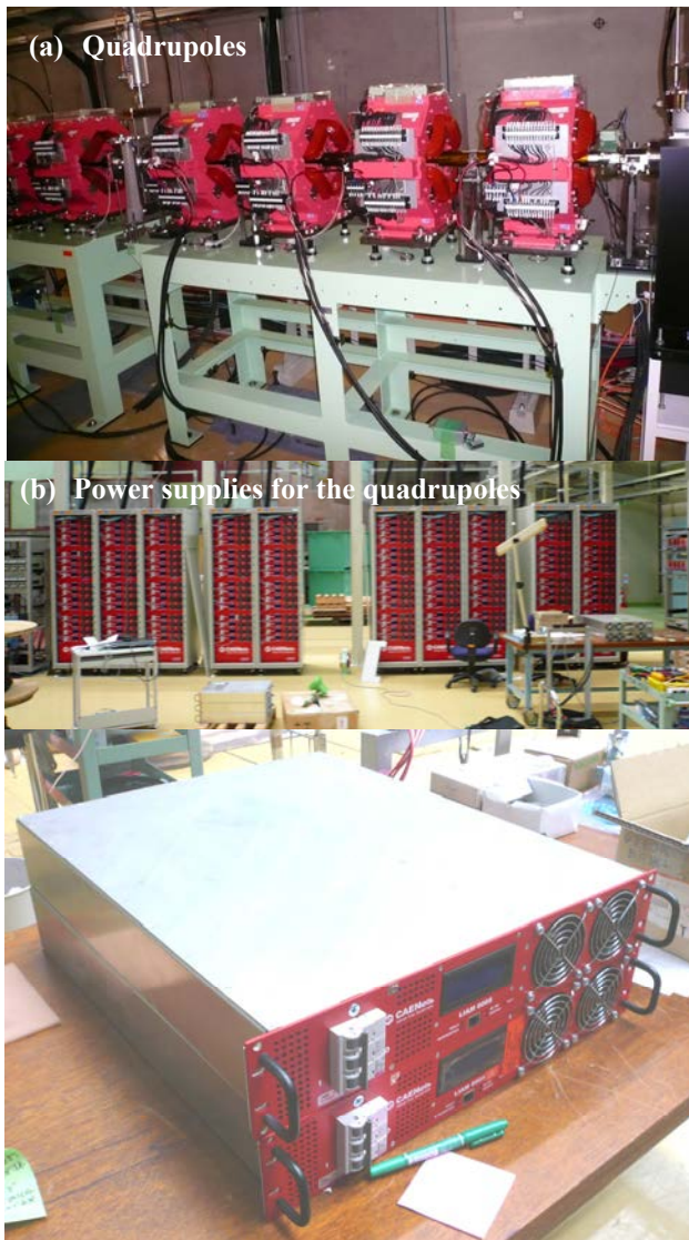
Figure 4: Quadrupoles and power supplies.

ない為、低エネルギー運転用に銅線の 4 極磁場用コイルも巻いてあり、現在はそちらのみ使っている。35MeV で K 値が 3 まで余裕を持って対応可能な巻き数となっている。水平垂直ステアリング用の補助コイルについては、精密補正用の 1 巻コイルと通常の補正用の 10 巻コイルとがあり、現在は 10 巻の方をステアリングとして使っている。（配置は図 1。）例えば、水平垂直ステアリングが必要な場所では、1 台の 4 極電磁石に 3 台の電源が接続されていることになる。