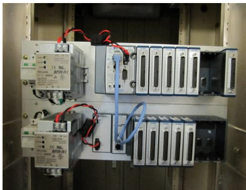
図 3： Compact-RIO（図中のイーサネット・ケーブルはシャーシ間を繋ぐ EtherCAT 用であり、Compact-RIO と IOC を接続するためのイーサネット・ケーブルは未接続の状態）

については既にその開発が完了し、長期安定性を確認するために、温度計測用のデータ・ロガー（横河電機社製 DA-100）との間で通信試験を行っている。