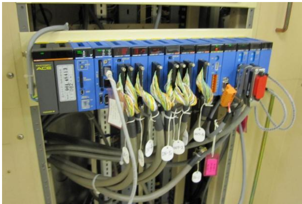
図 1：真空制御用 IOC (イーサネット・ケーブルが接続されたモジュールが F3RP61 であり、その左隣がインタロックのためのラダー・プログラムを実行するシーケンス CPU)

負う企業に EPICS による制御を委ねることが困難であることであるが、これについての例外的な事例を 4 節で述べる。また、そこでは PLC 以外のフロントエンド・コントローラとして MicroTCA の Advanced Mezzanine Card を IOC とした組込み EPICS についても紹介する。