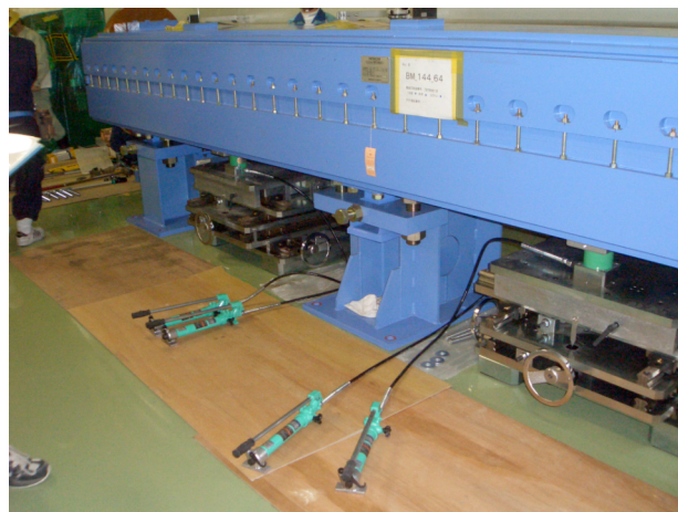
図 3 : 高荷重ステージをB-magにセットしたところ

偏向電磁石は重量が33tonあり、アライメント行うときの微小な調整やビーム方向への移動時に滑らかに移動しないため治具（高荷重ステージ）を制作した。高荷重ステージは電磁石を乗せ3次元で微少調整が行えることとした。ビームに対し前後左右はリニアモーションガイドを使用し、上下は油圧ジャッキにより構成した。電磁石の脚の間にセット