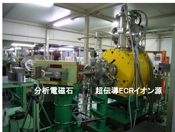
図2：18GHz超伝導ECRイオン源と分析電磁石

図2に超伝導ECRイオン源と分析電磁石等の写真を示す。超伝導ミラーコイルの冷却には伝導冷却式を採用し、約9日間で室温から通電可能な状態になる。運転を開始して間もないため、今のところ、安定にイオンを生成するためのコンディショニングに時間を要している。