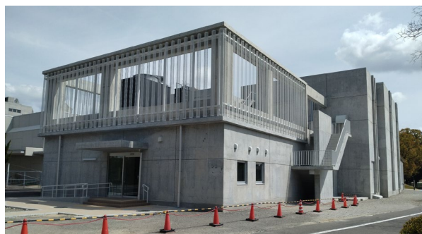
Figure 2: Photo of the TAT cyclotron building.

大阪大学が申請した「アルファ線核医学治療社会実装拠点」が採択され、拠点としての建物の建設が 2023 年度より急ピッチで行われてきた。この建物は 2024 年 2 月末に竣工し [2] (Fig. 2)、アルファ線核医学治療 (Targeted Alpha Therapy) の拠点ということで、TAT サイクロトロン棟と名付けられた。この建物には、TAT に必要な RI を製造するためのサイクロトロン、および、化学精製に必要な機器類を内部に持ち、定期的に大量の RI 製造を行い化学精製した RI を出荷するという役割が期待されている。現状では内部には機器類が全く設置されていないが、化学操作を行うための施設の導入に向けた向けて機種選定を実施している。2025 年度の初頭には RI 取り扱いを開始することを計画しているため、機種選定と設置、RI 排気設備の改修、RI 取り扱いの許可を得るための変更申請の準備を行っている。また、加速器の導入は 2026 年を予定しており、そのための準備も合わせて実施している。