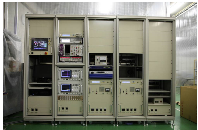
Figure 1: Appearance of the accelerator control system.

Figure 1 に示したものは製作工場からの出荷前の状態であり、実際の使用状態では各制御盤はそれぞれ目的に合わせて異なる場所に設置される計画である。